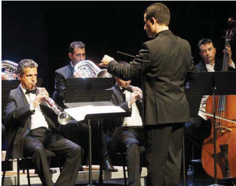
Cobla Simfònica Catalana

Acabem d'estrenar un nou portal web que persegueix tres finalitats: