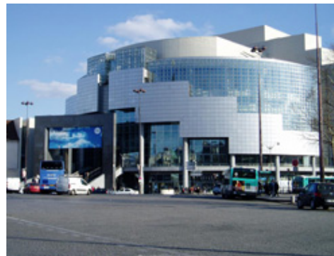
Òpera Nacional de París

L' Òpera Nacional de París , és un edifici de moderna construcció situat en el Districte XII de la ciutat de París. Anomenada també com el Teatre de l'Opera del Poble , s'inaugurà el 14 de Juliol de 1989, durant la celebració del 2on centenari de la caiguda de la Bastilla del 1789 en plena Revolució Francesa. L'edifici, projectat per l'arquitecte uruguaià Carlos Ott , constitueix una veritable ruptura amb els teatres del segle XIX. Es tracta d'un edifici encorbat i envidrat, que pot abastar fins a un total de 2700 espectadors. El seu disseny funcional i modern, amb butaques tapissades en negre, contrasta amb els murs de granit i l'impressionant sostre de vidre oferint una arquitectura innovadora i impactant. Posseeix 5 escenaris mòbils, fet que el defineix com una obra mestra de l'enginyeria tecnològica.