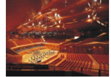
Auditorium Parco della Musica, Roma

16:10 Sortida del vol amb destinació Barcelona