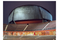
Auditorium Parco della Musica, Roma

Nota important: S'aconsella que tothom vagi proveït de la targeta sanitària europea que facilita la Seguretat Social. Cal portar el DNI.