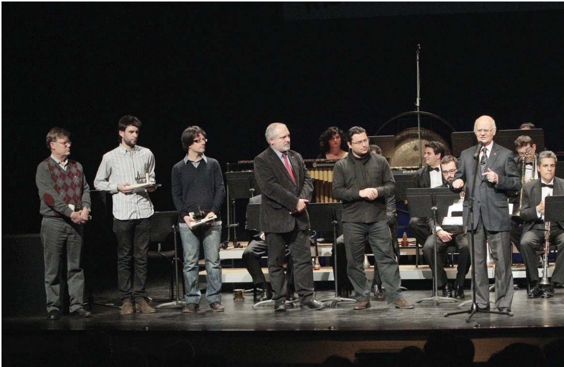
Lliurament de premis del certamen musical Ciutat de Sabadell, per part de les autoritats presents.